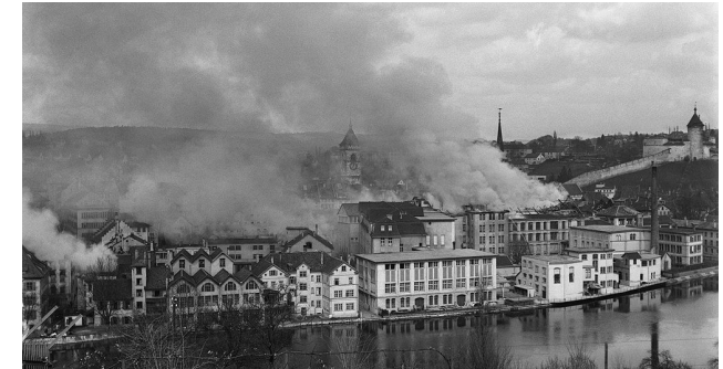
Bomben auf Schaffhausen Wie kam es, dass amerikanische Bomber am 1. April 1944 Schaffhausen bombardierten? Wie hat Schaffhausen die Krise gemeistert? Die Ausstellung gibt Antworten.