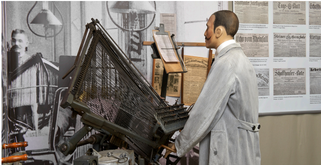
Landesstreik 1918 Die wirtschaftlichen, politischen und militärischen Fakten und Hintergründe zum Landesstreik in der Schweiz und im Besonderen in Schaffhausen. (bis Juni 2019)