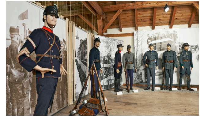
farbenfroh – feldgrau – getarnt 250 Jahre Bekleidung und Ausrüstung des Schweizer Soldaten. Die steigenden Anforderungen an die Ausrüstung werden vor dem historischen Hintergrund dargestellt.