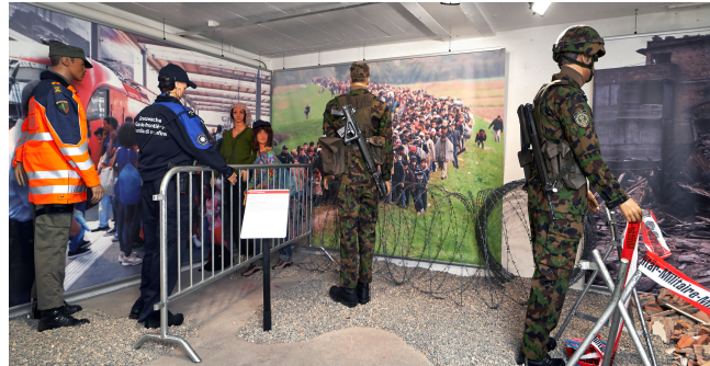
Mobilmachung 130 Mobilmachungen der Armee im historischen Kontext: Eine Geschichte der Einsatzbereitschaft und Weiterentwicklung der Armee und auch der Konflikte in und um die Schweiz.