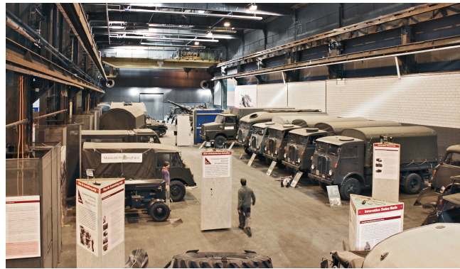
Motorisierung und Mechanisierung der Schweizer Armee 21 Panzer und 54 Radfahrzeuge, alle betriebsbereit. Ausstellung in der Stahlgießerei (ab Oktober 2019 im SIG-Areal)