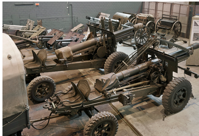
4 Schaudepots für Geschütze, Blasinstrumente, Ausrüstungsgegenstände und Artilleriegeräte ergänzen die Ausstellungen.

Das Museum präsentiert in den historischen Gebäuden des Kantonalen Zeughauses und in der ehemaligen Stahlgießerei im Mühlental (ab Oktober im SIG-Areal Neuhausen) sechs Ausstellungen und drei Schaudepots historischer Sammlungen. Das Museum organisiert regelmässig Sonderausstellungen und Vorführungen mit historischen Fahrzeugen und Geschützen.