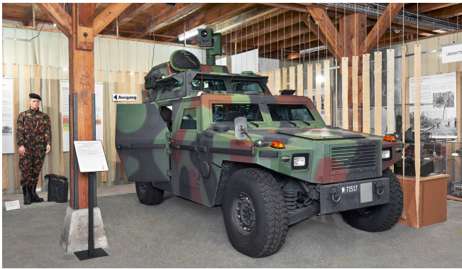
Artillerie gestern und heute Die technische und taktische Entwicklung der Schweizer Artillerie, informativ erläutert und anschaulich dargestellt mit zahlreichen Szenen und Exponaten.